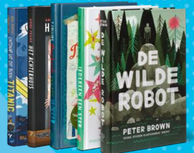
Leesclubboeken groep 7/8

Alle kinderen lezen dagelijks 30 minuten zelfstandig. Gedurende de eerste twee weken van een thema is dat in het Leesclubboek: het boek dat onderdeel uitmaakt van het lesmateriaal en dat de kinderen mogen houden. Als dat boek uit is, lezen de kinderen verder in twee of meer zelfgekozen boeken. Dat half uur is nodig om echt geconcentreerd te kunnen lezen en 'in het boek' te komen. De leerkracht leest daarnaast ook voor uit een boek; per thema is daar een Voorleesboek voor geselecteerd.